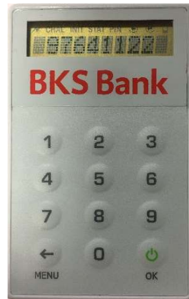
Odgovor na izazov (APPLI 2)